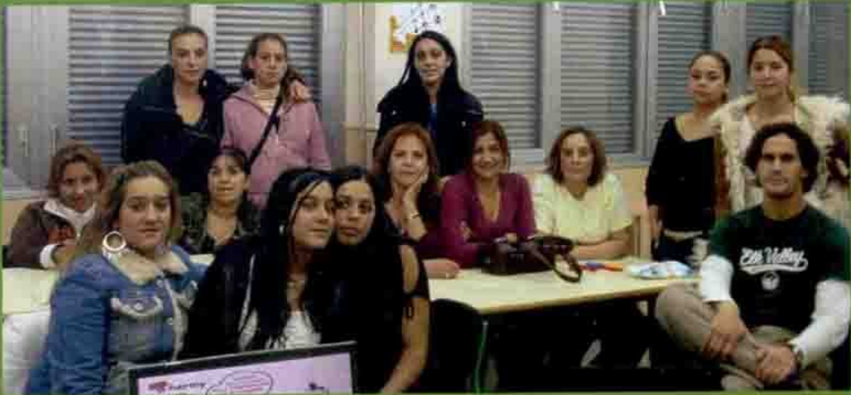
Participantes Curso "Manipuladora de Alimentos"

como dependienta, reponedora o camarera. Por otra parte, el Curso de Soldadura dotará a muchos jóvenes de las habilidades y conocimientos necesarios para poder convertirse en técnicos soldadores dentro de diferentes industrias.