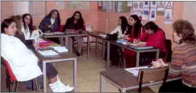
Alumnos durante el curso de carnet de conducir.