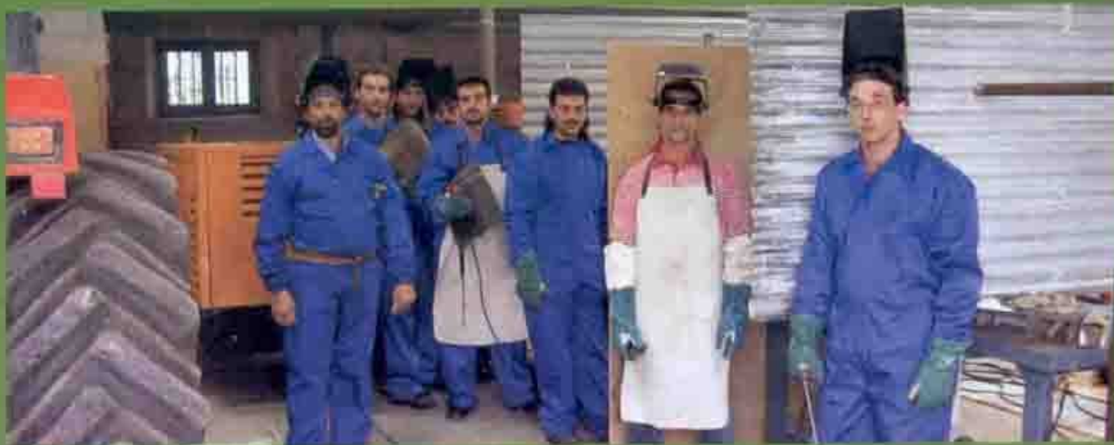
Participantes Curso "Soldadura"

Una vez más, repetimos que debemos centrar nuestros esfuerzos en el impulso de la cualificación profesional con el fin de alcanzar una mejora de las condiciones de acceso y permanencia de la población gitana en el empleo. Sólo de esta forma conseguiremos derribar poco a poco las barreras que nos impiden trabajar y encaminar a la Comunidad Gitana hacia un futuro lleno de ilusión, potencial e igualdad.